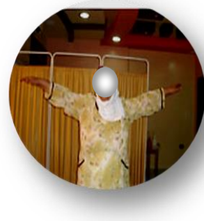
الشّكل (4- a)