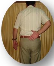
الشكل (2- a)

تميّزت المرحلة التالية للعمل الجراحي بظهور حثل ودي انعكاسي بعد شهر من الجراحة. تمّ تدبيره بصورة باكرة وفاعلية. وإليك ملخصاً مصوراً عن الوضع السريري بعد عشرة أشهر من العمل الجراحي (في آخر زيارة للمريض)؛ انظر الشكل (2).