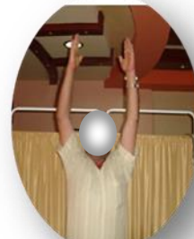
الشكل (2- c)