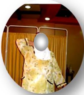
الشّكل (4- c)

أكدّ الكشف الجراحيّ الموجودات الشعاعيّة جميعها فيما خلا الورم الشّحمي؛ فقد كان هذا الأخير محاطاً بشكلٍ كاملٍ وجليّ بمحفظته التّشريحيّة. وأمّا التّطوّرات ما بعد العمل الجراحيّ فقد سجلّتها لكم صوراً خلال الزيارة الأخيرة للمريضة، انظر الشّكل (4).