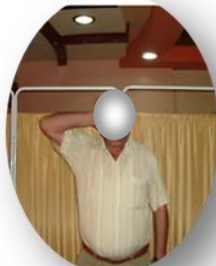
الشكل (2- b)